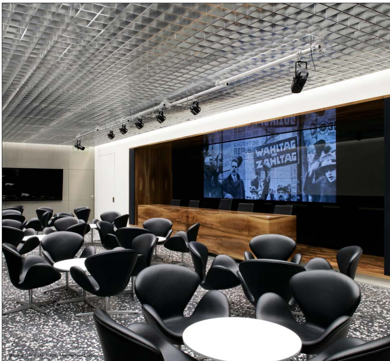
Parlament Wien [A] | Foto: Manfred Seidl, Wien

Das sehr ästhetische und hochwertige PARABOLRASTER aus Aluminium ist vielfältig einsetzbar, z.B. in Büros und Museen.